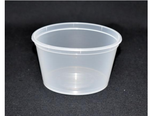
Possibilité d'IML ou d'étiquetage manuel.

Température d'utilisation : -18°C /+ 70 °C (chauffage à 70°C au maximum pendant 2 heures au maximum en lien avec les conditions du test de migration). Scellabilité : sans objet Contact alimentaire ► tous types d'aliments (en lien avec le certificat d'alimentarité)