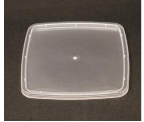
Possibilité d'étiquetage manuel.

Température d'utilisation : -18°C /+ 70 °C (chauffage à 70°C au maximum pendant 2 heures au maximum en lien avec les conditions du test de migration). Scellabilité : sans objet Contact alimentaire ► tous types d'aliments (en lien avec le certificat d'alimentarité)